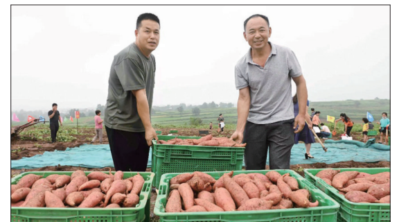
汝阳红薯喜获丰收(资料图片)