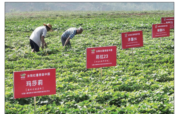
汝阳红薯试验田(资料图片)

本报讯(洛报融媒记者 吕百营 通讯员 王念丽)记者昨日从汝阳县获悉,该县成功创建全国绿色食品原料(红薯)标准化生产基地,标志着我市再添“国字号”绿色食品原料生产基地。