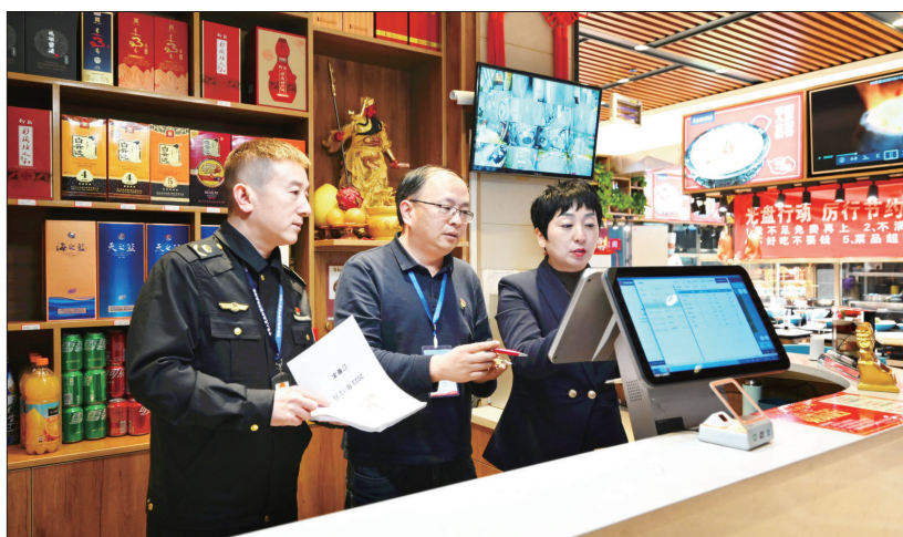
偃师区纪委监委紧盯关键少数、重点场所,深入各大酒店、饭店、“农家乐”等重点场所开展交叉式监督检查,严防“四风”问题反弹回潮。图为近日,该区纪检监察干部在某酒店前台核查消费记录、账目发票等。