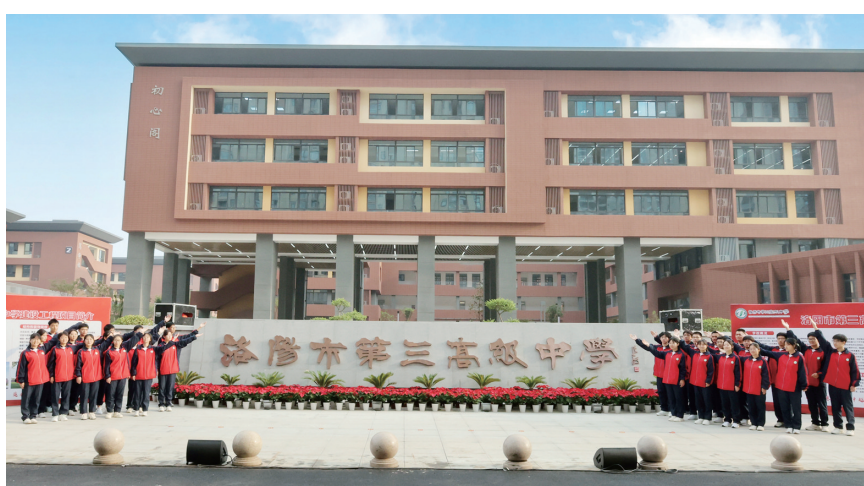
洛阳市第三高级中学校门

学校迁建,改变的不仅是环境,更是办学气象。洛阳市第三高级中学认真落实党委领导的校长负责制,以“五星”支部创建和文明校园创建统领学校工作,鼓励全体党员、团员做表率,带动全体师生步调一致谱写学校教育新篇章。 聚焦立德树人根本任务,实行“书院制”和“中心制”的现代管理模式。该