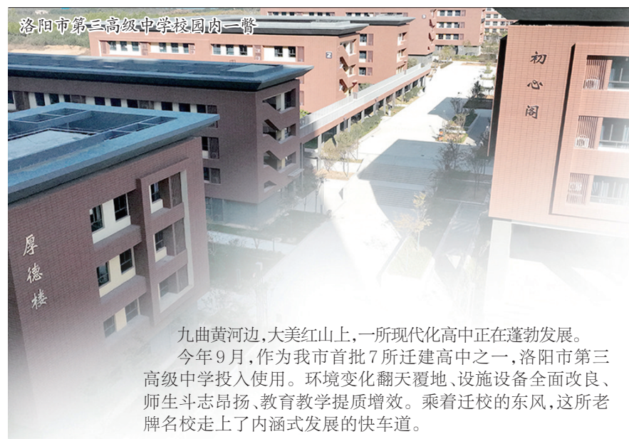
九曲黄河边,大美红山上,一所现代化高中正在蓬勃成长。今年9月,作为我市首批7所迁建高中之一,洛阳市第三高级中学投入使用。环境变化翻天覆地,设施设备全面改良、师生斗志昂扬、教育教学提质增效。乘着迁校的东风,这所老牌名校走上了内涵式发展的快车道。

洛阳市第三高级中学位于西工区周山大道与香叶路交叉口西北角,坐北朝南,占地150亩,建筑面积7.8万平方米。校园设计前瞻性强,建设标准高,项目推进力度大,极大地改善了办学条件,能满足3300名师生发展和新时代高中高质量发展的需要。 进入学校大门,映入眼帘的是综合楼“初心阁”,沿“初心阁”西侧中轴线“长征路”从南向北拾级而上,三个年级书院在左侧梯次而建,并由户外连廊连通,形成了一道美丽的风景线;右侧是体育馆和“百味园”食堂。“立雪路”横贯东西,路北教师公寓“青蓝居”、学生公寓“博雅居”“博文居”“博文居”从西往东依次分布。沿“立雪路”向东,便是视野开阔、布局合理、色彩鲜明的现代化操场。校园东环路“强国路”、北环路“映雪路”、西环路“祝融路”、南环路“行知路”,加上校内道“复兴路”“踏雪路”及“行知广场”“航天广场”“运动场”,形成了思政、科技、人文“三统一”的“31383”校园文化建设格局。