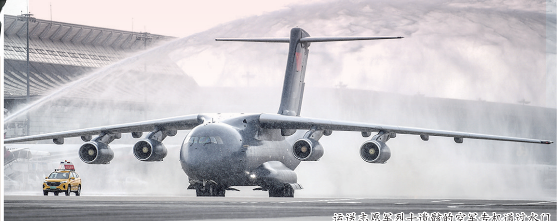
运送志愿军烈士遗骸的空军专机通过水门