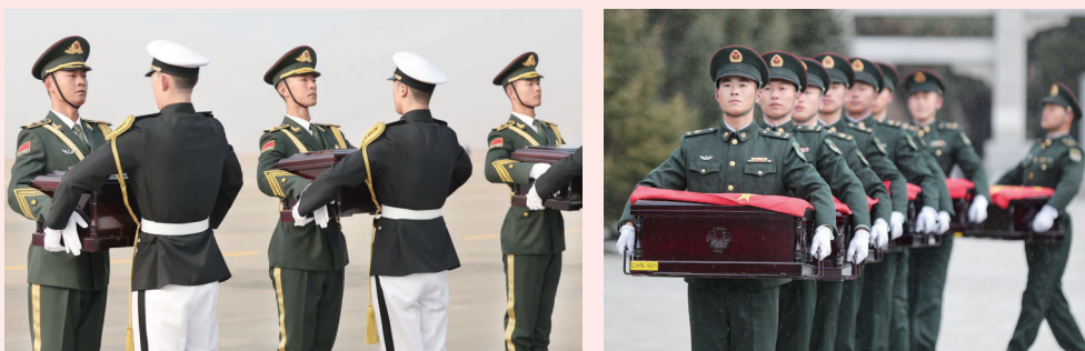
在韩国仁川国际机场,中国人民解放军礼兵(左)从韩方接过中国人民志愿军烈士棺椁