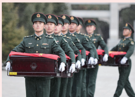
志愿军烈士遗骸及相关遗物回到祖国