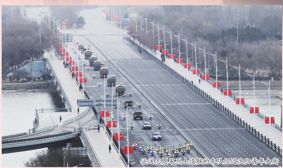
运送志愿军烈士遗骸的车队经过沈阳青年大街