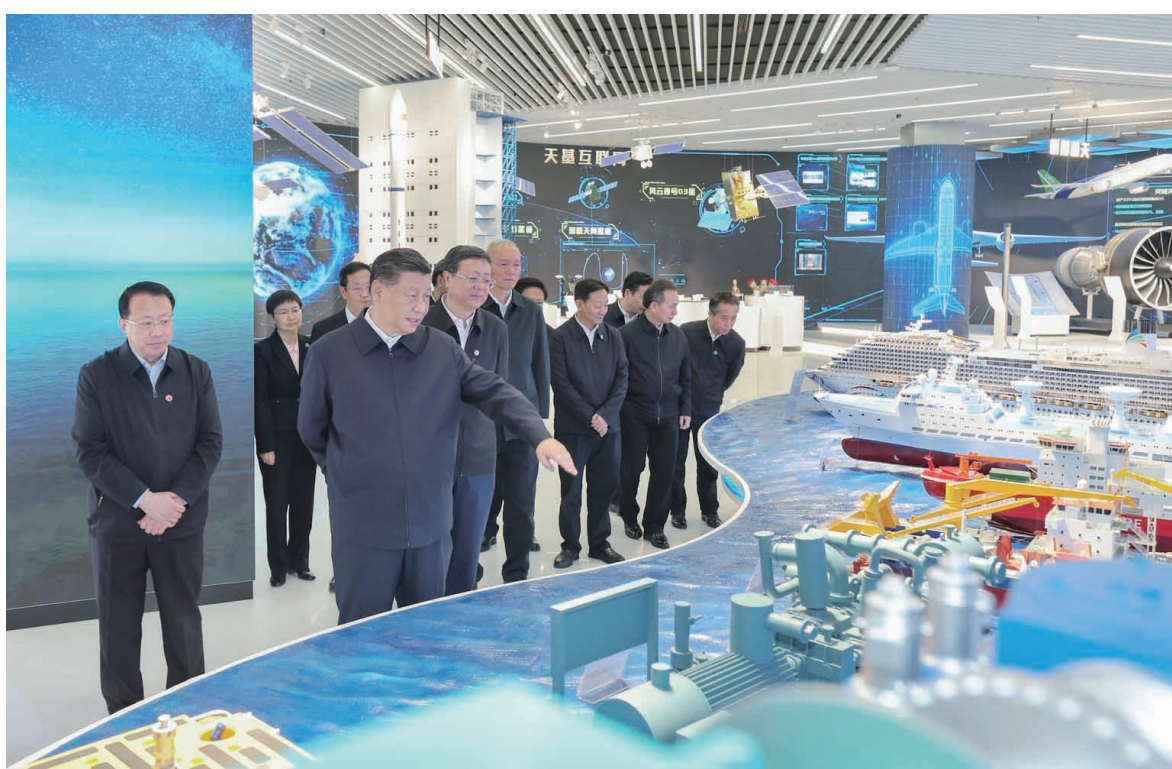
11月28日至12月2日,中共中央总书记、国家主席、中央军委主席习近平在上海考察。这是11月28日下午,习近平在浦东新区张江科学城参观上海科技创新成果展。

新华社上海江苏盐城12月3日电 中共中央总书记、国家主席、中央军委主席习近平近日在上海考察时强调,上海要完整、准确、全面贯彻新发展理念,围绕推动高质量发展、构建新发展格局,聚焦建设国际经济中心、金融中心、贸易中心、航运中心、科技创新中心的重要使命,以科技创新为引领,以改革开放为动力,以国家重大战略为牵引,以城市治理现代化为保障,勇于开拓、积极作为,加快建成具有世界影响力的社会主义现代化国际大都市,在推进中国式现代化中充分发挥龙头带动和示范引领作用。