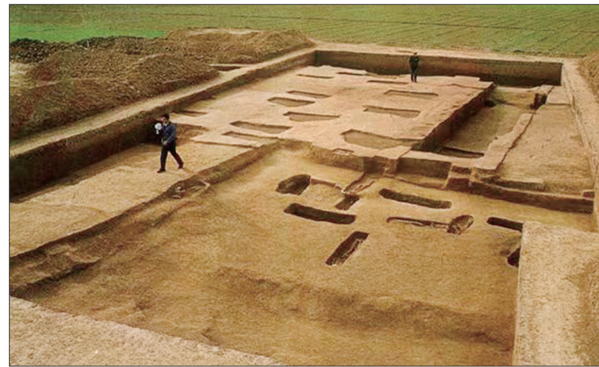
偃师商城遗址1984年考古发掘现场 (资料图片)

时值初冬,在位于洛阳市区以东约40公里的偃师商城遗址内,考古发掘及相关研究工作正有序进行。作为商代早期都城遗址,这座古城始建于公元前16世纪,延续使用近200年,距今已有3500多年。