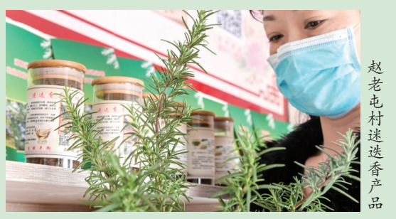
赵老屯村迷迭香产品

赵老屯村的变化，是宜阳县牢固树立和践行“绿水青山”就是“金山银山”理念的缩影。近年来，该县不断探索“绿水青山”向“金山银山”转化的有效途径，取得扎实成效。