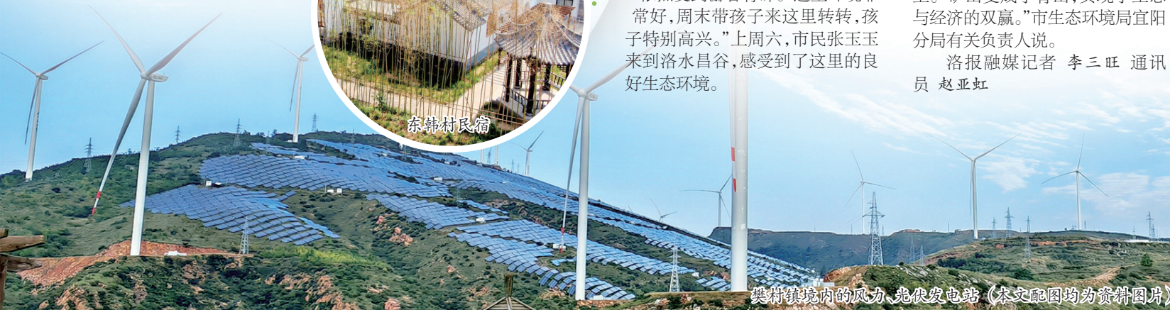
樊村镇境内的风力、光伏发电站