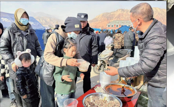
受灾群众排队取餐

北京时间12月18日23时59分,甘肃临夏州积石山县发生6.2级地震,震源深度10公里。地震发生后,各方连夜组织力量赶赴震区开展抢险救援,目前人员搜救、伤员救治、受灾群众转移安置等各项抗震救灾工作正在紧张有序进行。