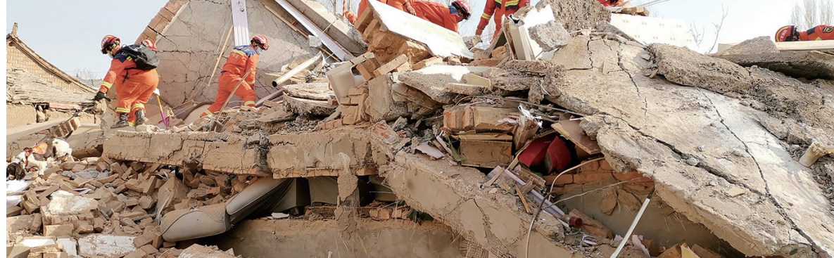
救援人员在积石山县大河家镇进行救援

记者从西部战区联合指挥中心了解到,西部战区陆军第76集团军某旅约300名官兵连夜出动,于凌晨4时许到达受灾严重的积石山地震灾区,迅速展开人员搜救、道路清理等工作。武警甘肃总队出动300余名官兵、40余台车辆抵达积石山县刘集乡4个村,担负搜救、伤员转运、疏通道路和搭建帐篷等任务。甘肃省军区临夏军分区就近组织民兵根据任务划分分队赶赴各点位执行任务。