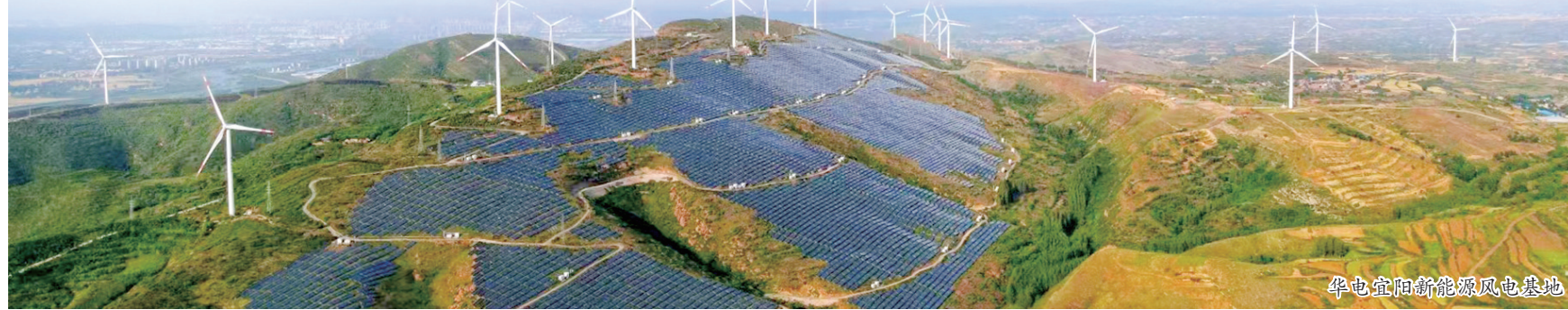
华电宜阳新能源风电基地