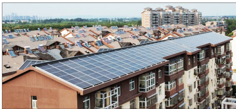
洛龙区一小区用上“绿电”

四五”期间,洛阳将围绕太阳能高效利用,积极支持利用开发区、标准厂房、大型公共建筑屋顶发展分布式光伏发电,探索开展光伏建筑一体化开发示范。