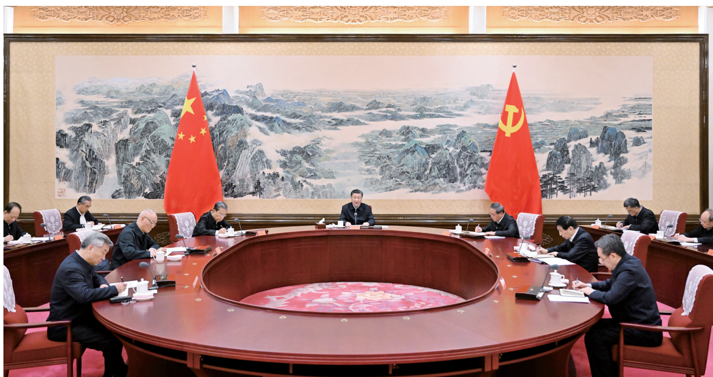
12月21日至22日,中共中央政治局召开学习贯彻习近平新时代中国特色社会主义思想主题教育专题民主生活会,中共中央总书记习近平主持会议并发表重要讲话。

新华社北京12月22日电 中共中央政治局于12月21日至22日召开学习贯彻习近平新时代中国特色社会主义思想主题教育专题民主生活会,聚焦学思想、强党性、重实践、建新功总要求,对照凝心铸魂筑牢根本、锤炼品格强化忠诚、实干担当促进发展、践行宗旨为民造福、廉洁奉公树立新风具体目标,按照以学铸魂、以学增智、以学正风、以学促干重要要求,联系中央政治局工作,联系带头旗帜鲜明讲政治、带头学懂弄通做实习近平新时代中国特色社会主义思想、带头贯彻党中央决策部署、带头践行宗旨为民