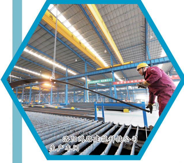
洛阳鸿路建筑科技有限公司生产车间

推动龙泽能源与新奥燃气合作,实施煤气制天然气、氢气项目;南山铝业引进新能源汽车电池托盘,链接服务中州时代项目;结合汝阳农特产品丰富、国家地标产品数量居全省第一的独特优势,积极发展预制菜产业;加快推进京东电商物流园项目、中农北斗项目,为抢抓新一轮产业发展机遇打下坚实基础。