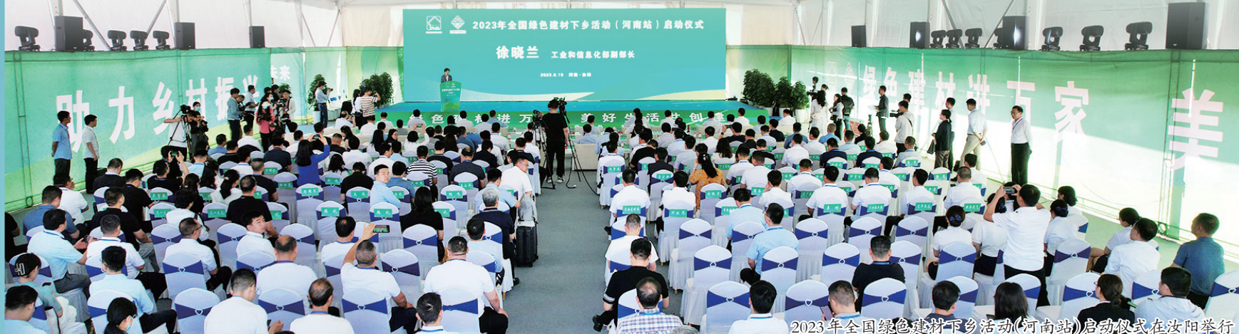
2023年全国绿色建材下乡活动(河南站)启动仪式在汝阳举行