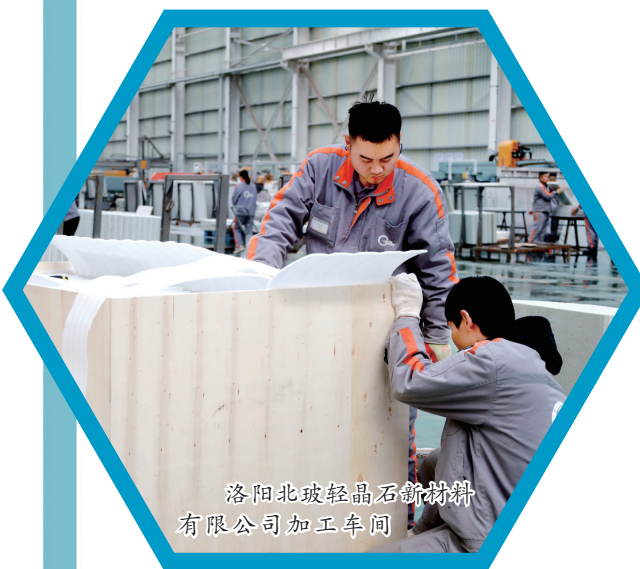
洛阳北玻轻晶石新材料有限公司加工车间

推进财权、事权理顺,根据职能运行情况,推进开发区20%财政收入向属地乡镇分配,进一步深化推进开发区市政执法、市场监管等社会事务管理职能向属地政府、县直单位剥离移交,制定开发区经济发展、服务保障、运营三张清单,促使开发区更加聚焦主业。