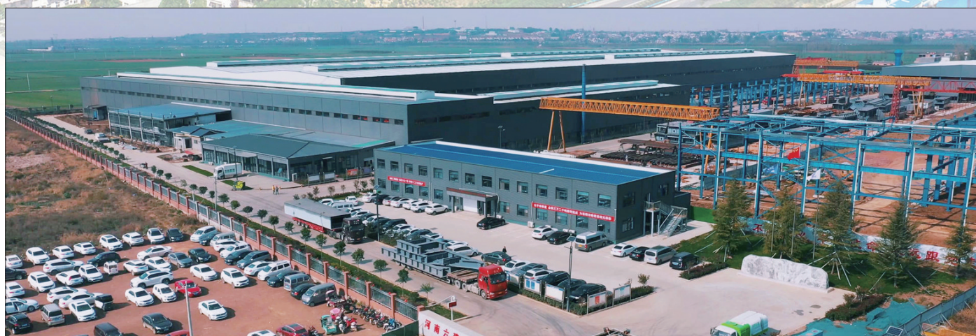
河南六建重工厂区

汝阳县先进制造业开发区的入选,传递了高质量发展的信号,更蕴藏着奋进的密码。近年来,汝阳县委、县政府认真贯彻落实中央、省、市关于推动开发区高质量发展指导文件和专题会议精神,认真落实洛阳市产业发展“136”工作举措、汝阳县“13361”工作思路,聚焦经济建设主责主业,促改革、强产业、快改造、抢投资、抓项目,一大批产业项目形成新的集聚效应,助推县域经济“筋骨”更壮、“活力”更足、“风口”更盛。