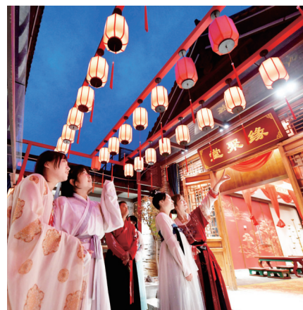
新文旅添彩“夜经济”