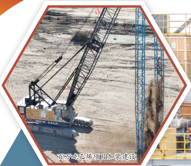
百万吨乙烯项目加紧建设