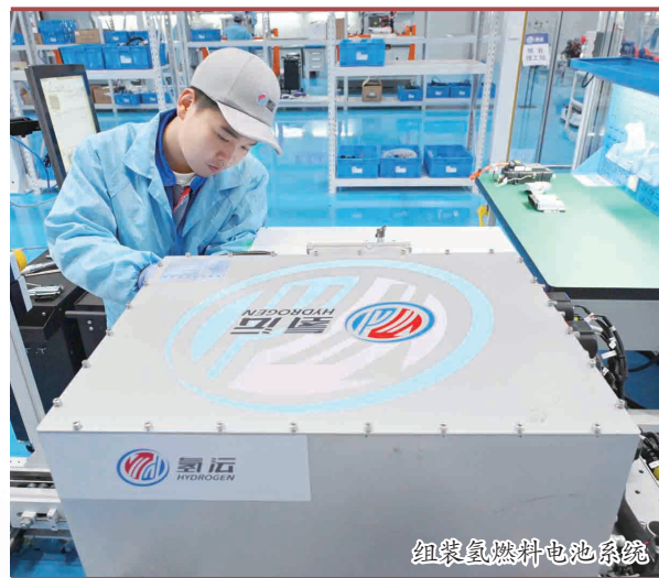
组装氢燃料电池系统

数实融合、创新驱动、载体建设……洛阳产业乘“风”而起的动能还在不断增强。目前全市拥有省市两级产业研究院19家,18家科技产业社区进驻企业超千家,集聚创新人才万余人,全市660个“三大改造”项目完成年度计划投资1.3倍,已建成国家级智能制造示范工厂2家、省级智能工厂89家、绿色工厂50家。随着“含新量”“含金量”“含绿量”不断攀升,洛阳产业发展正加速跃上新台阶。