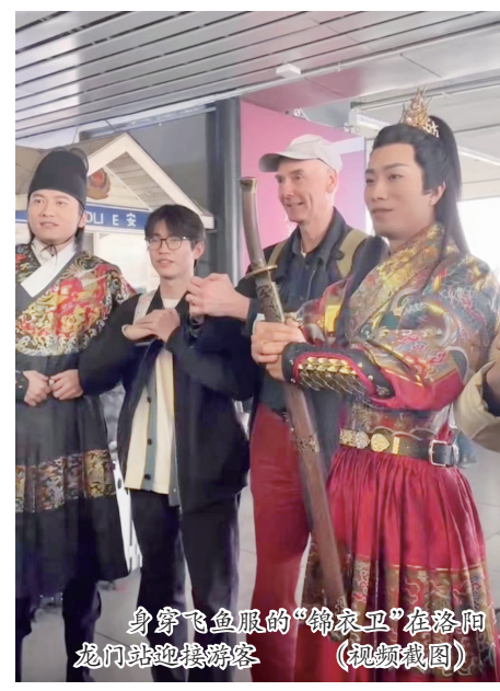
身穿飞鱼服的“锦衣卫”在洛阳龙门站迎接游客 (视频截图)