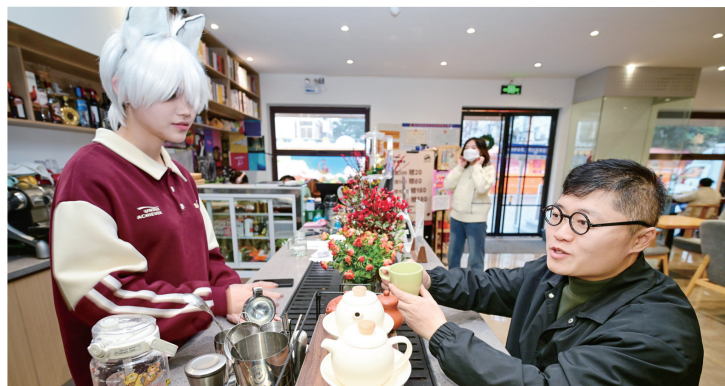
街区店铺文艺范儿十足