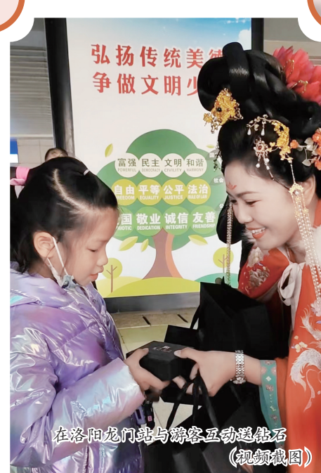
在洛阳龙门站与游客互动送钻石 (视频截图)