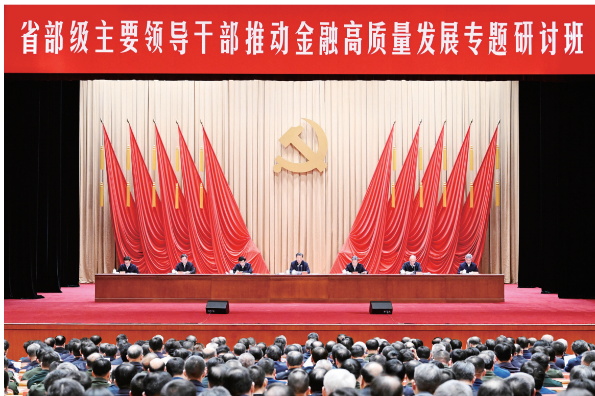
1月16日,省部级主要领导干部推动金融高质量发展专题研讨班在中央党校(国家行政学院)开班。中共中央总书记、国家主席、中央军委主席习近平在开班式上发表重要讲话。赵乐际、王沪宁、蔡奇、丁薛祥、李希、韩正出席开班式。

新华社北京1月16日电 省部级主要领导干部推动金融高质量发展专题研讨班16日上午在中央党校(国家行政学院)开班。中共中央总书记、国家主席、中央军委主席习近平在开班式上发表重要讲话强调,中国特色金融发展之路既遵循现代金融发展的客观规律,更具有适合我国国情的鲜明特色,与西方金融模式有本质区别。我们要坚定信心,在实践中继续探索完善,使这条路越走越宽广。