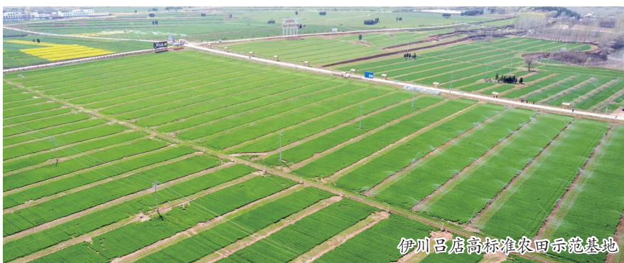
伊川吕店高标准农田示范基地