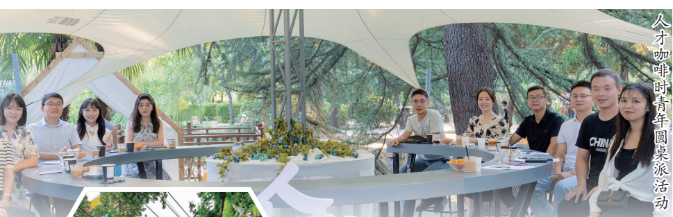
人才咖啡时青年圆桌派活动

“这么大的支出,咱们能兑现吗?”“对于落实人才政策,我们不能‘不见兔子不撒鹰’,要拿出诚意来。”在涧西区委专题会议上,区委主要负责同志“一锤定音”。近期,《涧西区支持青年人才创新创业若干举措(试行)》正式对外发布,包括重奖企业引才、实施贡献奖励、支持自主创业、落实事后奖励、加大生活补贴、升级安居保障、培育本土人才、赋能人才评价、保障子女入学、优化留才环境等含金量十足的10项内容。这“金十