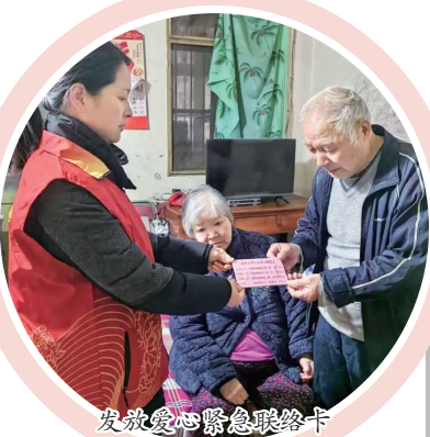
发放爱心紧急联络卡

冬至以来，我市新时代文明实践活动开展“暖冬模式”。近期，在各地新时代文明实践中心（所、站），一系列贴近群众需求、服务群众生活的文明实践活动有序开展，让广大市民真切感受到了冬日里的温情。