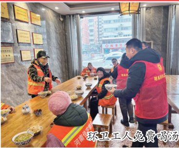
环卫工人免费鸡汤