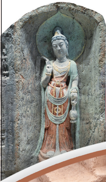
打印复原的「龙门最美观音」