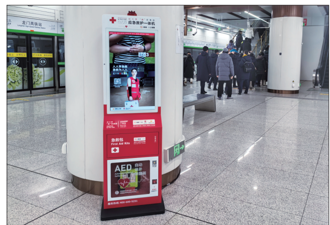
在洛阳地铁站启用的应急救援一体机

本报讯(洛报融媒记者 蒋颖颖 通讯员 闫雪 李战功)昨日上午,“滴滴应急救援”洛阳轨道交通红十字应急救援一体机捐赠活动在洛举行,中国红十字基金会“滴滴应急救援”项目向洛阳地铁捐赠71套应急救援一体机。