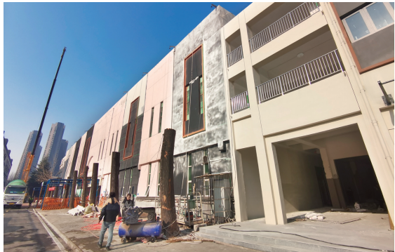
理工附中餐厅焕然一新

目前,科大附中餐厅三楼改造工程已完成新屋顶钢结构构件、室外电梯设备安装等节点任务,本月底前将完成主体屋面结构施工,奋力冲刺4月1日前具备就餐条件目标。理工附中餐厅改造工程同样高效,目前进入收尾阶段,2月中旬前将完成灶具、燃气安装调试工作,春季开学后交付使用。