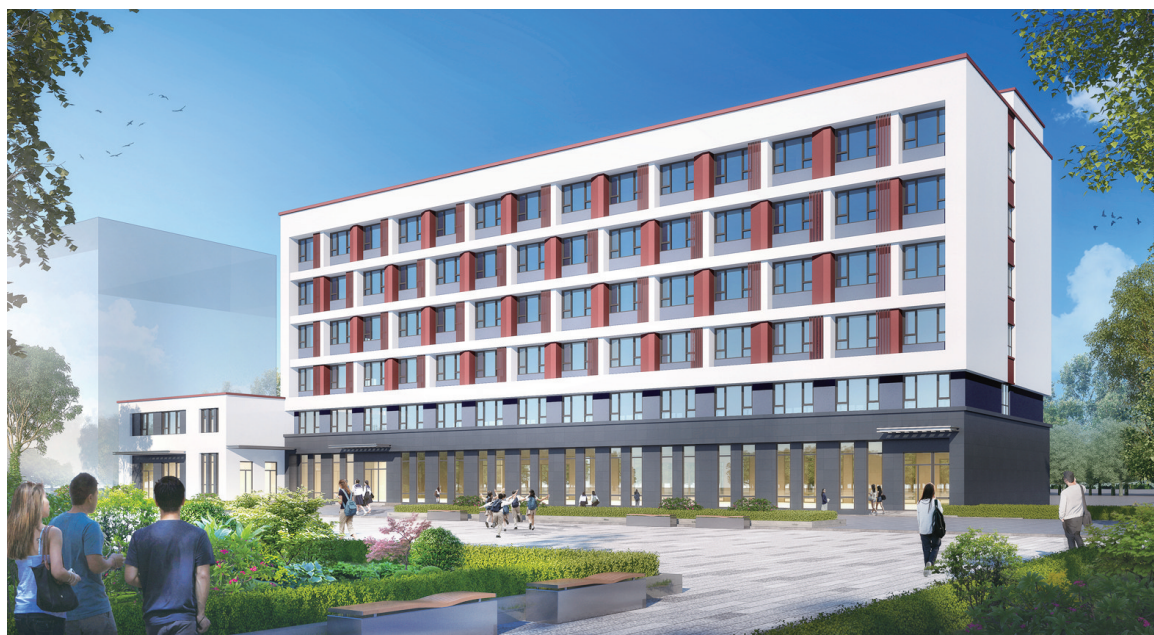
洛六高新建餐厅宿舍楼效果图

市住建局相关负责人表示,将持续完善施工方案,全力做好要素保障,推进项目建设跑出“加速度”,推动民生工程早日完工、尽快投用,为师生提供更加舒适安全的校园环境。