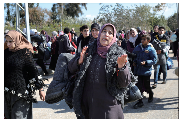
以军轰炸加沙南部和中部造成至少34人死亡

春运伊始,中国铁路南宁局集团有限公司的铁路工人在中越铁路沿线开展搜山扫石作业,防止坡面碎石风化剥落、崩塌到线路上,筑牢国际大通道的春运安全屏障。