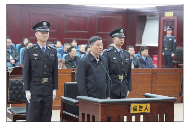
中国足协原主席陈戌源一审被控受贿8103万余元 1月29日,湖北省黄石市中级人民法院一审公开开庭审理了中国足协原党委副书记、主席陈戌源受贿一案。图为庭审现场(2024年1月29日摄)。