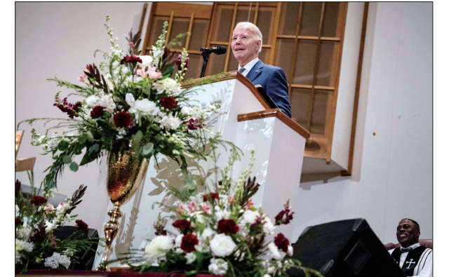
拜登:3名驻约旦美军士兵在无人机袭击中死亡 1月28日,美国总统拜登在南卡罗来纳州西哥伦比亚一座教堂内发表讲话。美国总统拜登28日说,驻扎在约旦东北部靠近叙利亚边境的美军东时间27日晚遭无人机袭击,造成3名美军士兵死亡、多人受伤。