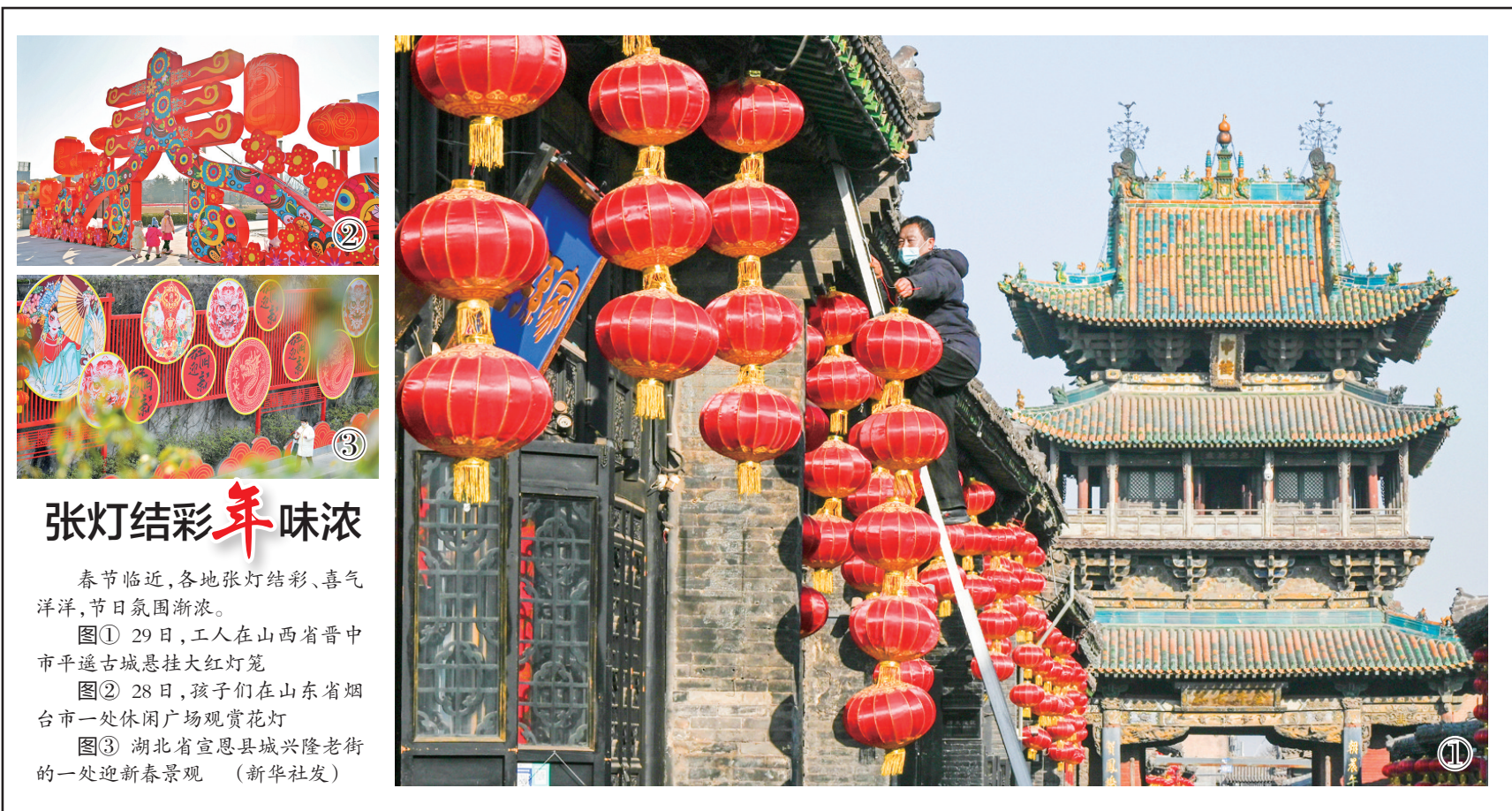
张灯结彩年味浓 春节临近,各地张灯结彩、喜气洋洋,节日氛围渐浓。 图① 29日,工人在山西省晋中市平遥古城悬挂大红灯笼 图② 28日,孩子们在山东省烟台一处休闲广场观赏花灯 图③ 湖北省宣恩县城兴隆老街的一处迎春景观

会秩序等。危害未成年人身心健康问题方面,重点整治利用“网红儿童”违规牟利、攻击恶搞,侵害未成年人合法权益;突破青少年模式关于时间、内容等方面的限制要求,向未成年人特别是农村留守儿童变相提供诱导沉迷的产品功能等。