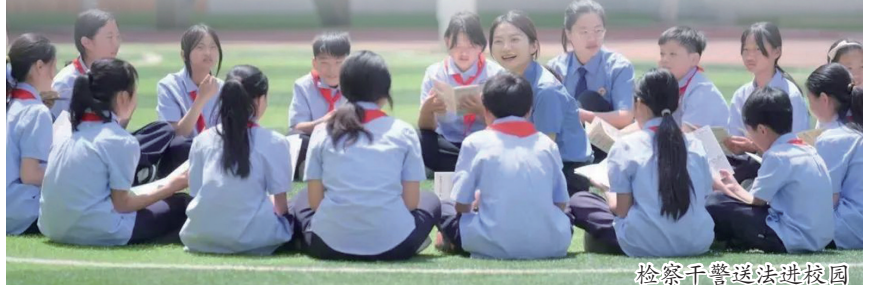
检察官送法进校园