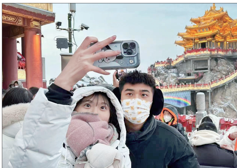
网速更快,游客体验感更好