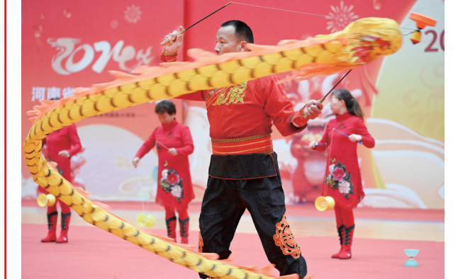
昨日,2024年河南省新春空竹大赛在洛阳市体育中心体育馆拉开帷幕。大赛由河南省体育局、河南省体育总会等单位主办,河南省全民健身中心、洛阳市体育局承办,设团体、单轮自选套路、双轮自选套路三大项目,共有全省15个省辖市16支代表队的170名选手参加。