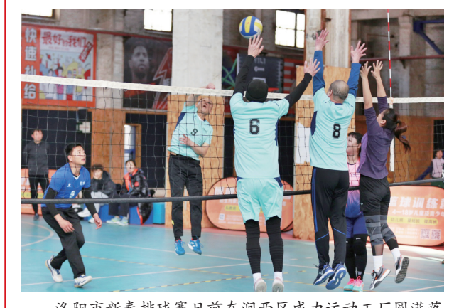
洛阳市新春排球赛日前在涧西区威力运动工厂圆满落幕。本次比赛共有11支代表队的160余名选手参加,分为排球、气排球两个项目。经过两天的激烈较量,“四川小灶”队夺得排球项目第一名,洛阳墨龙俱乐部夺得气排球项目第一名。