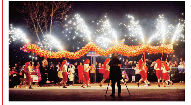
春节期间,孟津区举办了丰富多彩的打铁花、舞狮、排鼓、戏曲、汉服巡游等民俗表演活动,天天有演出,村村有节目,极大地丰富了群众的节日文化生活。