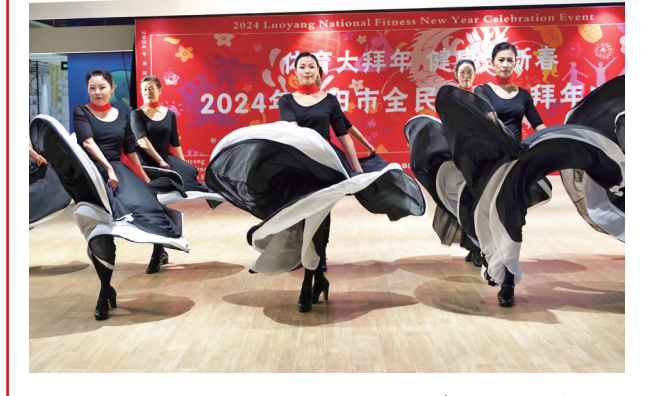
17日至18日,2024年洛阳市全民健身大拜年体育舞蹈展演活动在洛阳正大广场精彩举行。活动由市体育局、市体育总会主办,市体育舞蹈运动协会承办,分为广场健身舞、体育模特、体育舞蹈3个专场,吸引来自全市各县区的近千名舞者参加。