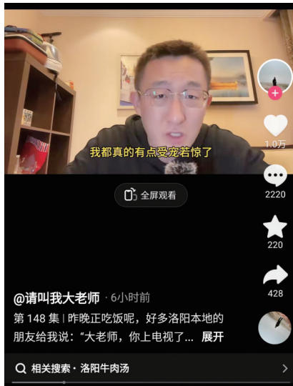
“大老师”再发视频感谢洛阳