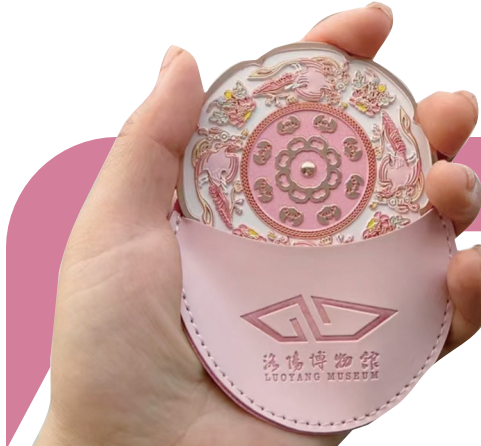
小红书网友分享的朱颜镜(资料图片)

龙年春节，文创产品成为备受游客青睐的洛阳“新特产”。昨日，记者从市文物局获悉，今年春节假期，到访文博场所的年轻游客占比达七成，带动文创国潮消费升温。洛阳厚重的历史文化，正以一种崭新的方式为世人所熟知。