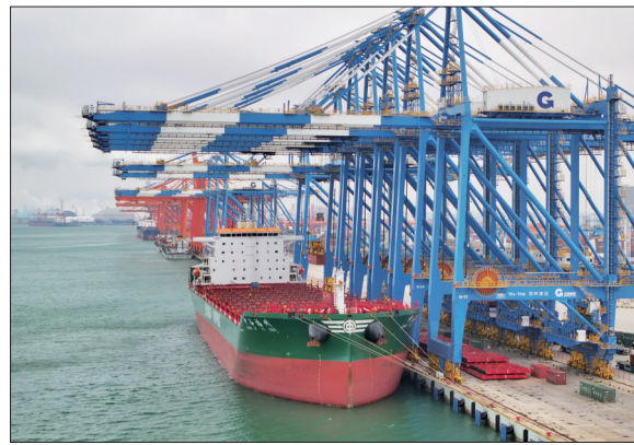
广西北部湾港货运忙

2月23日拍摄的广西北部湾港钦州港区的码头堆场(无人机照片)。 春节假期刚过,广西北部湾港的码头到处呈现繁忙工作景象。据介绍,今年以来,广西北部湾港货物吞吐量增长势头明显。今年1月份,广西北部湾港货物吞吐量达2583.30万吨,同比增长8.45%。