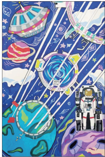
作品《太空电梯:飞往太空的天路》