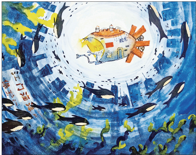
作品《蛟龙探海·保护海洋:大洋深处的“中国梦”》