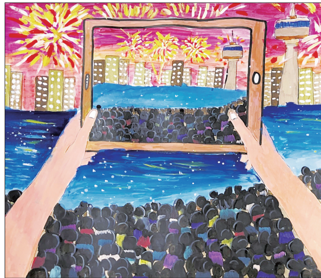
作品《烟花耀濠江 照亮幸福新生活》