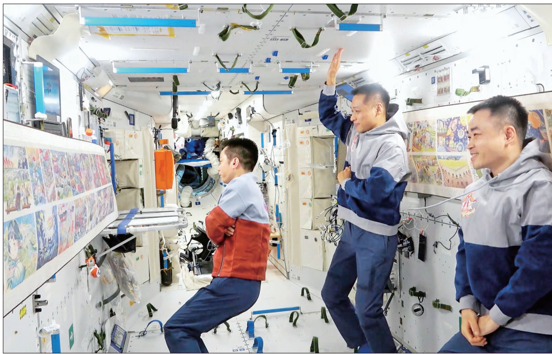
2月23日,神舟十七号航天员乘组在轨展示和介绍第三届“天宫画展”作品(视频截图)

新华社北京2月23日电 2月23日,第三届“天宫画展”在中国空间站开展。正在太空出差的神舟十七号航天员乘组在轨展示和介绍了新时代青少年畅想中国式现代化的美丽画卷。 本届画展自2023年10月正式启动征集,最终53幅画作从2万多幅报名作品中脱颖而出,随天舟七号货运飞船进入中国空间站。据介绍,画展以“孩子眼中的中国式现代化”为主题,围绕“人口规模巨大的现代化”“全体人民共同富裕的现代化”“物质文明和精神文明相协调的现代化”“人与自然和谐共生的现代化”“走和平发展道路的现代化”等专题进行展示。 作为全国青少年广泛参与、依托中国空间站这一“窗口”打造的航天特色文化品牌,“天宫画展”至今已成功举办三届,在社会上特别是青少年中产生良好反响。