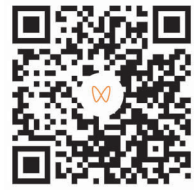
扫码观看相关视频