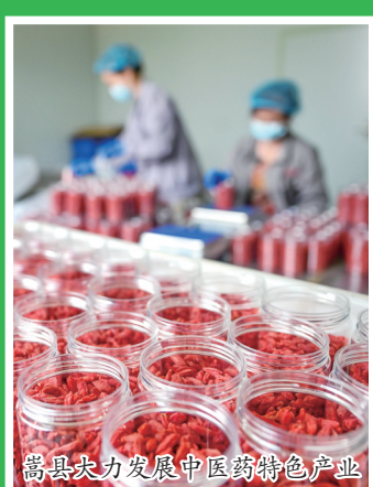
嵩县大力发展中医药特色产业