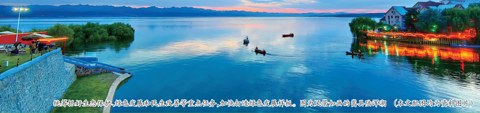
统筹抓好生态保护、绿色发展和民生改善等重点任务,加快打造绿色发展样板。图为风景如画的嵩县陆浑湖(本文配图均为资料图片)

▶▶安全生产精准执法和帮扶行动 落实“领导+专家”机制,运用“四不两直”、明察暗访、异地交叉执法、“互联网+执法”等方式,推进精准安全监管执法。加强执法业务培训,提升安全生产监管队伍能力作风。完善举报渠道和奖励机制,激励从业人员积极报告身边的事故隐患,提出整改的合理化建议。 ▶▶全民安全素质提升行动 聚焦“人人讲安全,个个会应急”主题目标,组织安全发展示范园区、示范企业创建,持续开展安全生产月、119消防宣传月、交通安全日、安全宣传咨询日等活动,推动安全宣传进企业、进农村、进社区、进学校、进家庭。 洛报融媒记者 郭旭光 通讯员 胡婷婷