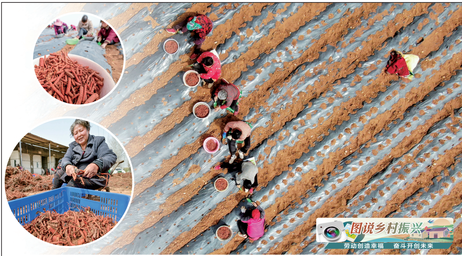
图说乡村振兴 劳动创造幸福 奋斗开创未来

会议强调,要扎实做好当前重点工作,着力推动全国两会精神落到实处。把学习贯彻落实全国两会精神与贯彻落实省委、市委关于今年工作的部署要求结合起来,扭住“三项重点工作”,用好“三个重要抓手”,持续推动干部转理念、提能力、强作风,着力稳定经济运行,抓好项目建设,促进民营经济高质量发展,深化重点领域改革,有效防范化解重大风险,确保年度目标顺利完成,以优异成绩迎接中华人民共和国成立75周年。各县区、市直各部门主要负责同志等参加会议。