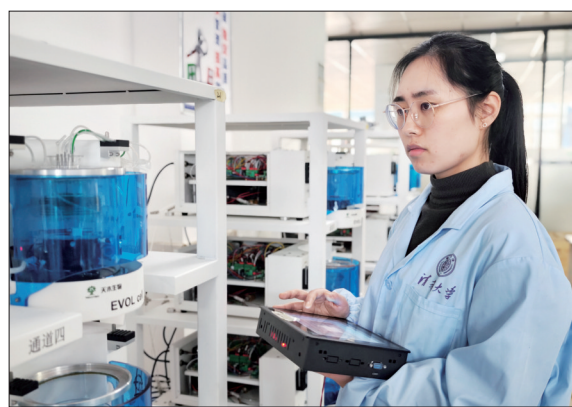
▲研究人员测试设备运行 ▲高通量微升级液滴培养组学系统设备

“今年全国两会强调的新质生产力理念,对我们开展创新工作很有启发。后续企业还将加快数字化生物育种创新体系布局,为推动高质量发展取得更大