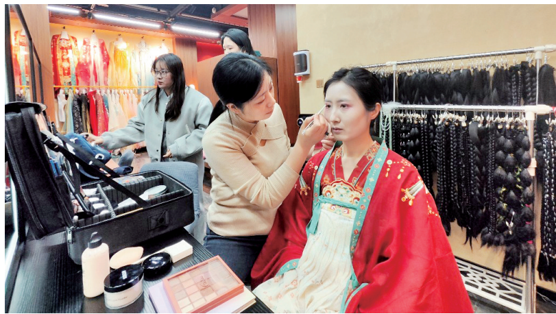
顾客体验汉服妆造

利用。该地下人防工程地处西工小街,区位优势明显,将其活化利用能够吸引更多服务,为街区发展注入新活力。