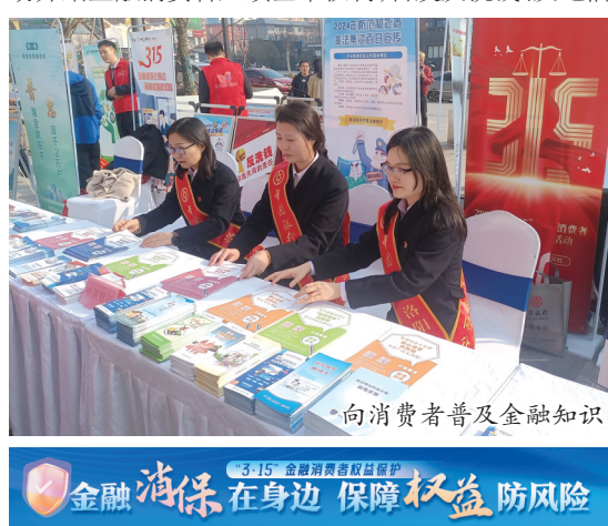
向消费者普及金融知识