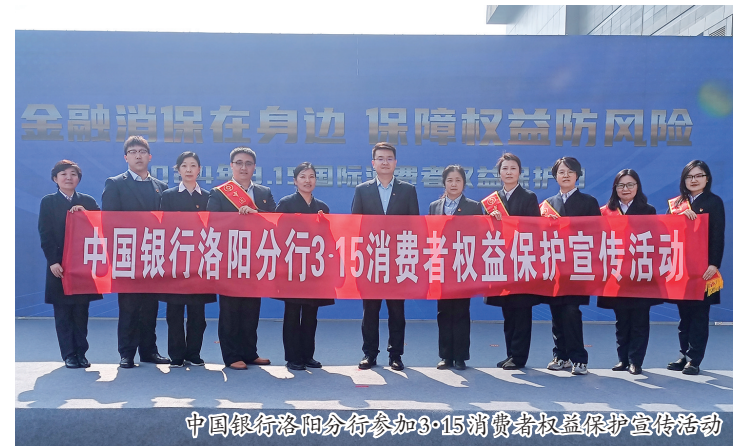
中国银行洛阳分行参加3·15消费者权益保护宣传活动

为做好3·15国际消费者权益日宣传活动,中国银行洛阳分行积极开展一系列以“金融消保在身边 保障权益防风险”为主题的金融消保宣教活动。该行本着金融为民的理念,将金融消费者教育作为提升公众金融素养的关键,以实际行动践行社会责任,唱响中行好声音。