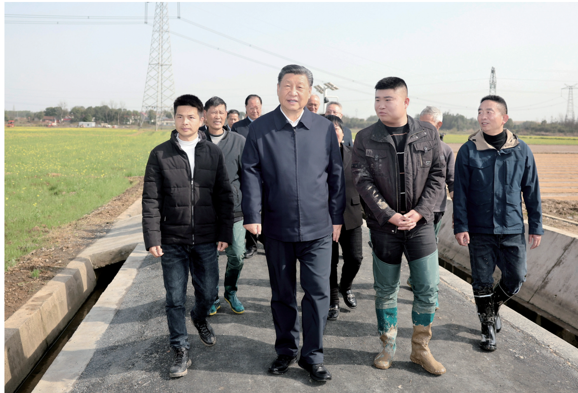
3月18日至21日,中共中央总书记、国家主席、中央军委主席习近平在湖南考察。这是19日下午,习近平在常德市鼎城区谢家铺镇港中坪村,同种粮大户、农技人员、基层干部亲切交流。

新华社长沙3月21日电 中共中央总书记、国家主席、中央军委主席习近平近日在湖南考察时强调,湖南要牢牢把握自身在构建新发展格局中的战略定位,坚持稳中求进工作总基调,坚持高质量发展不动摇,坚持改革创新,求真务实,在打造国家重要先进制造业高地、具有核心竞争力的科技创新高地、内陆地区改革开放高地上持续用力,在推动中部地区崛起和长江经济带发展中奋勇争先,奋力谱写中国式现代化湖南篇章。