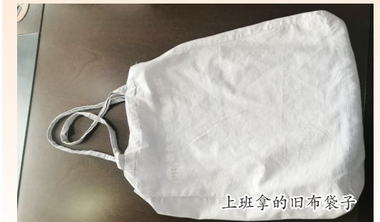
上班拿的旧布袋子