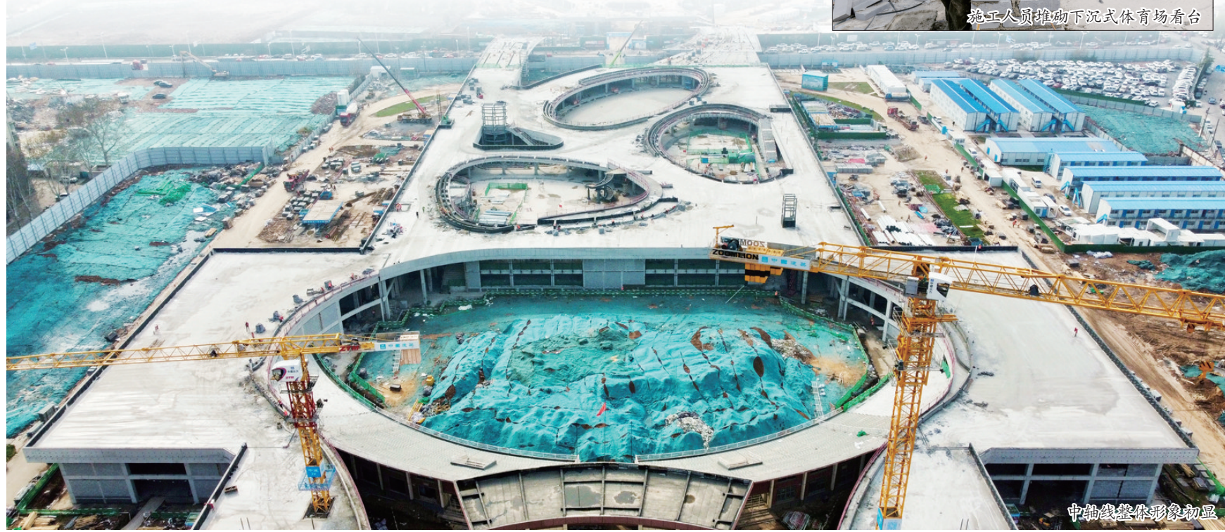
中轴线整体形象初显