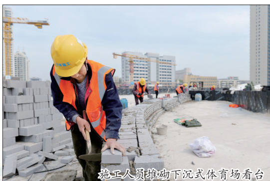
施工人员推动下沉式体育场看台