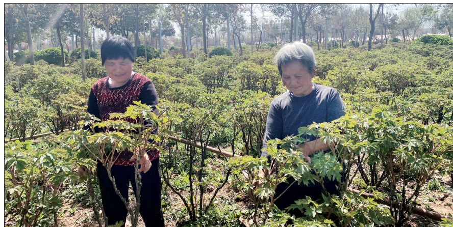
工人们在养护牡丹

品,用于满足农业种植小微企业经营性融资需求。”工商银行洛阳分行相关负责人说,“种植e贷·牡丹贷”作为其衍生产品,专门用于从事洛阳牡丹产业发展的小微企业,助力洛阳牡丹与文旅、经济融合发展。