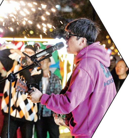
夜间市集“潮味”十足

我市各特色商业街区将实行一街区一特色,采取“演艺+体验”的形式,丰富夜间消费新场景。活动亮点如下——