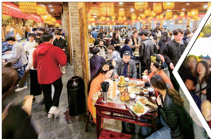
游客在西工小街特色文旅商业街区逛夜市、品美食