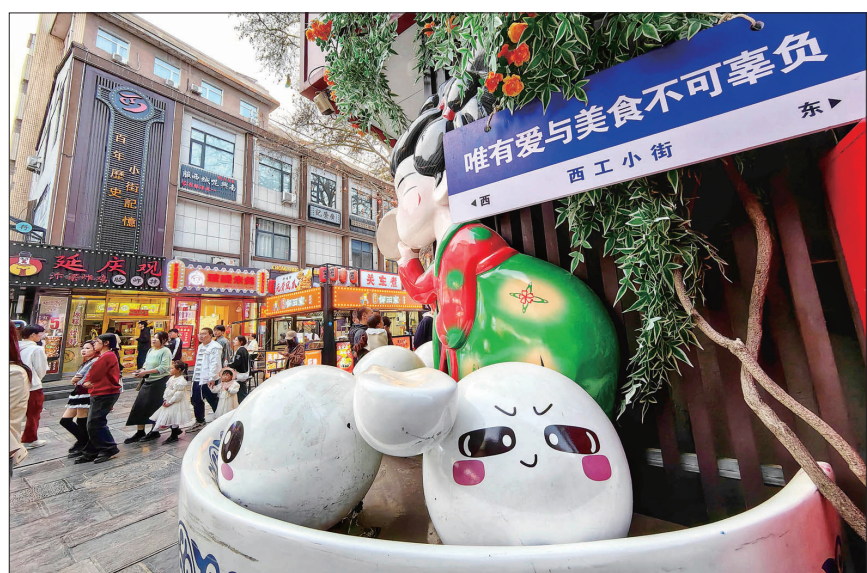
西工小街成为游客美食打卡地 洛报融媒记者 张光耀 摄

下一步,我市将重点做好四个方面工作:持续推荐全市名企、名店、名吃申报认定“中华老字号”“河南老字号”“洛阳老字号”;完成广州市场、铜驼春雨、西工小街等步行街改造提升,鼓励“老字号”集体进驻、抱团发展;持续举办“老字号”嘉年华活动,对“老字号”和非遗、文创、预制菜及特色产品开展集中