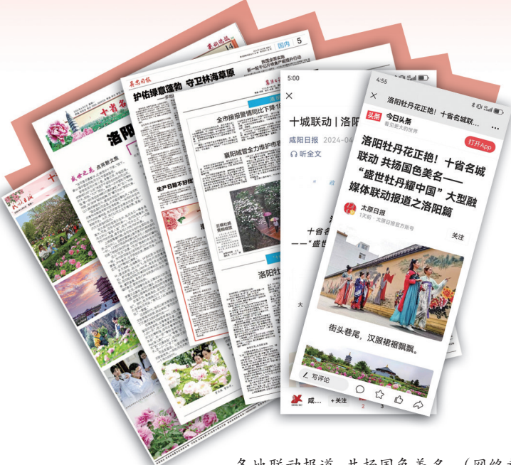
各地联动报道,共扬国色美名 (网络截图)

“洛阳三月花如锦,多少工夫织得成。”农历三月,牡丹花又开遍洛阳城,铺就一片繁花似锦盛景。随着洛阳日报社牵头组织策划的《十省名城联动 共扬国色美名》——“盛世牡丹耀中国”大型融媒体联动报道持续推进,全国网友除了一睹洛阳牡丹盛世美颜,也看到了全国各地牡丹之乡的风采。