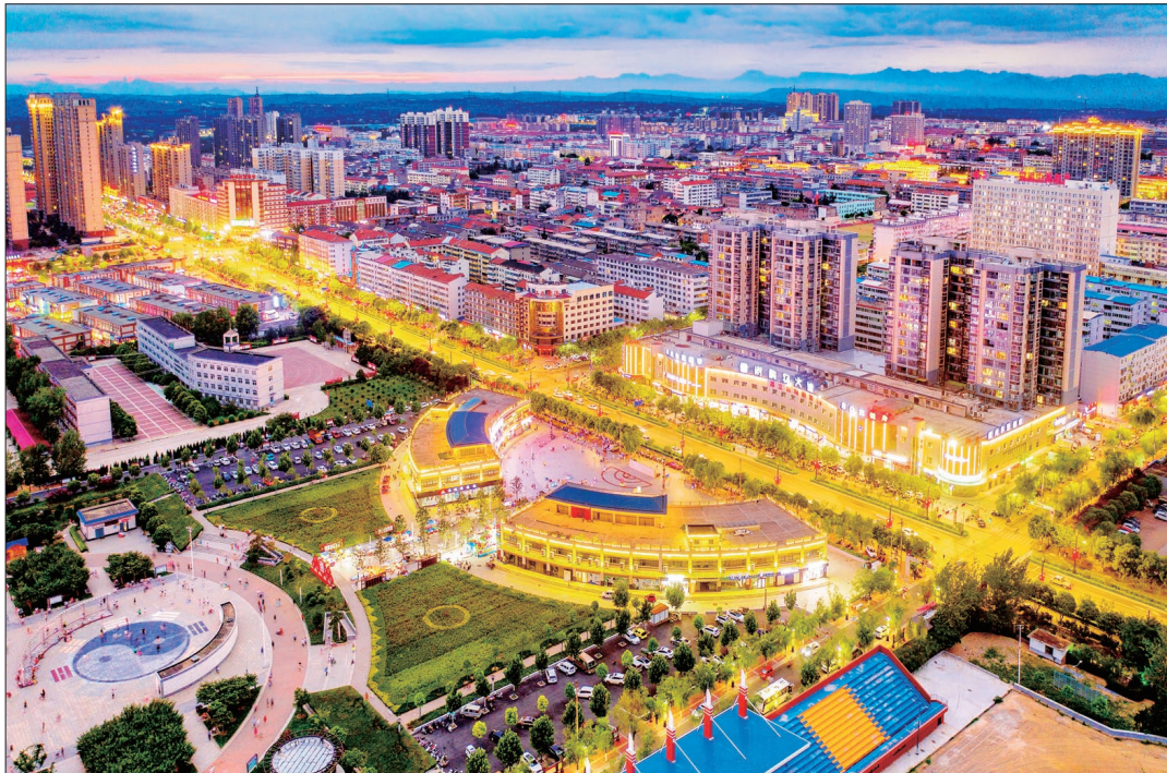
孟津城市夜景五彩斑斓 (资料图片)

“区城市管理局每天出动600多人、机扫车辆100多辆、小型冲洗车辆20多辆,日均洒水600多吨,对道路两侧景观小品、公益广告、石桌石凳、公交站亭、公路护栏、垃圾桶及公园游园内的城市家具进行全覆盖大规模清洗整治,对机械刷洗不到的位置和城市家具表面张贴的小广告,进行人工铲除和清洗,确保做到干净整洁,无灰尘、无污渍、无涂写、无粘贴,以崭新的城市面貌提升环境品质,助力全国文明城市创建。”区城市管理局负责人说。