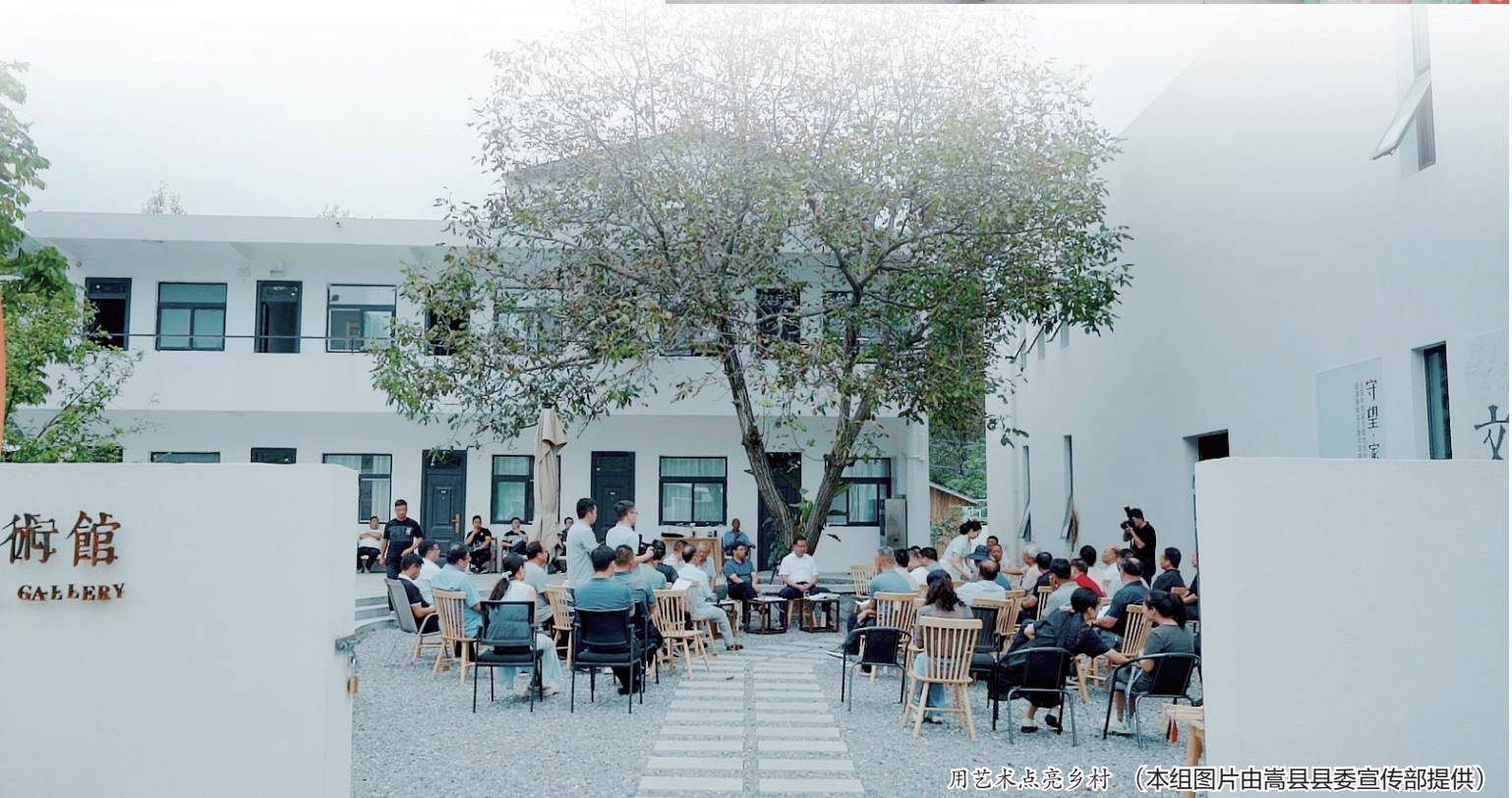
用艺术点亮乡村