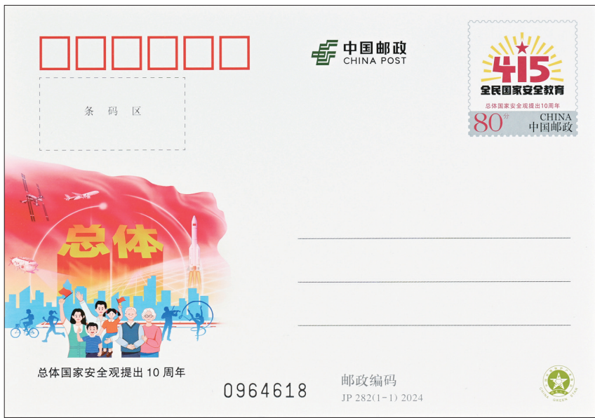
4月15日,中国邮政发行《总体国家安全观提出10周年》纪念邮资明信片1套1枚,《总体国家安全观提出10周年》纪念封由中国集邮有限公司同日发行

在云南德宏芒市机场,民警组织开展“出境前的国家安全课”,向乘客介绍当前国家安全局势、总体国家安全观相