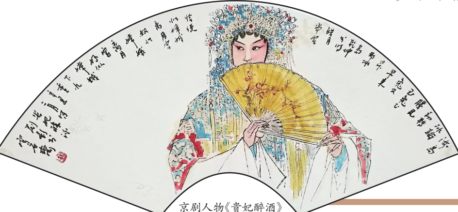
京剧人物《贵妃醉酒》