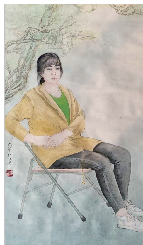
工笔人物《春风得意图》