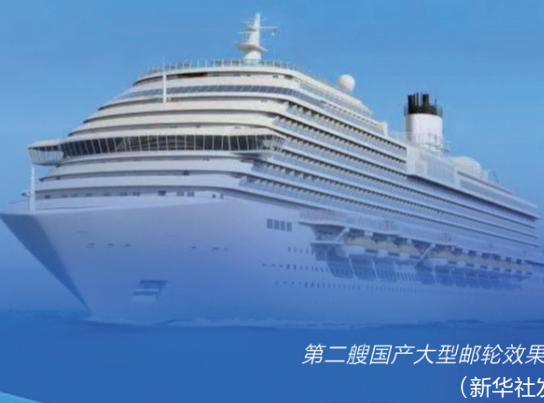
第二艘国产大型邮轮效果图

4月20日 长341米、宽37.2米、总吨位超14万吨 国产大型邮轮“2号船” 进入中国船舶集团上海外高桥造船有限公司2号船坞 这标志着我国邮轮建造批量化设计建造能力基本形成