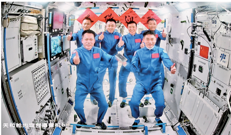
神舟十七号、神舟十八号航天员乘组“全家福”

为国家航天重大工程贡献力量,已成为洛阳轴承集团股份有限公司当下的“新常态”。为助力“神十八”成功飞天,该企业利用现代设计分析技术,创新研制了适用于“神十八”的多款轴承。该批产品具有高精度、高可靠性、轻量化等特点,能够高效保障航空航天机械系统的转动、定位和承载,不仅能满足飞船基本功能需求,让飞船动