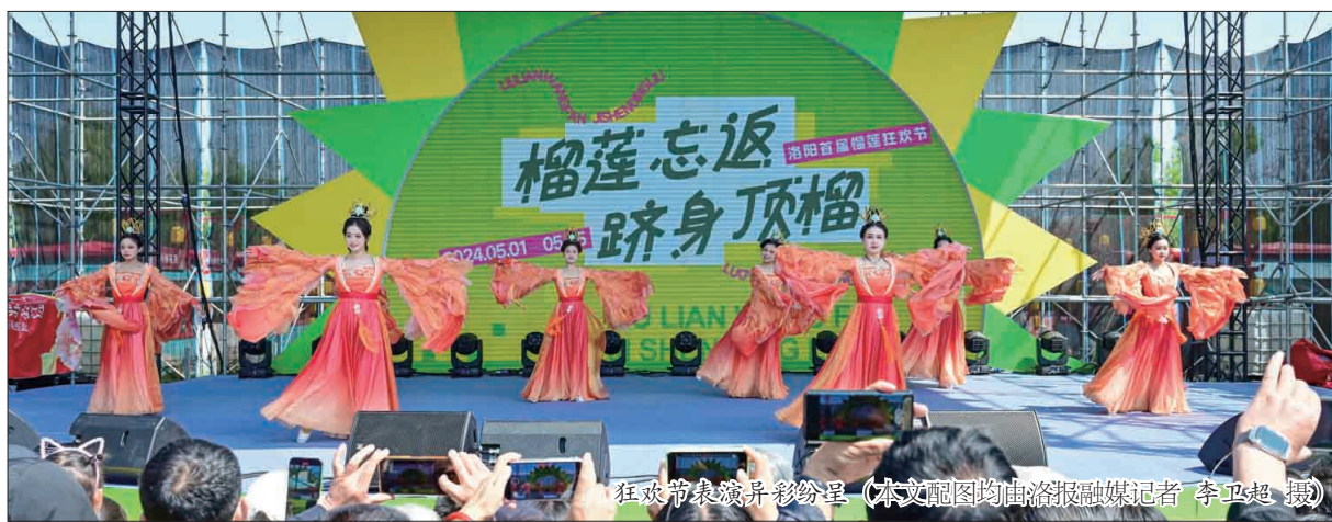
狂欢市集异彩纷呈