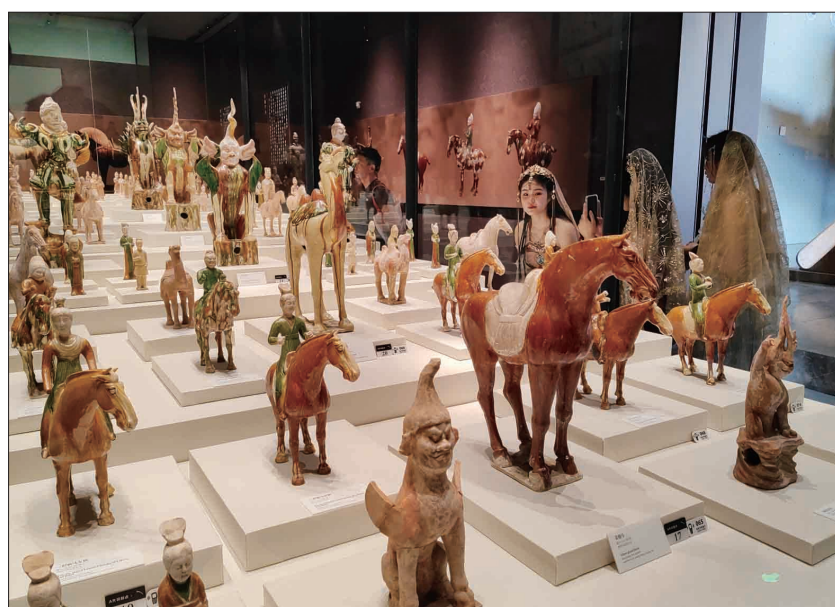
隋唐大运河文化博物馆精美文物吸引游客“打卡”