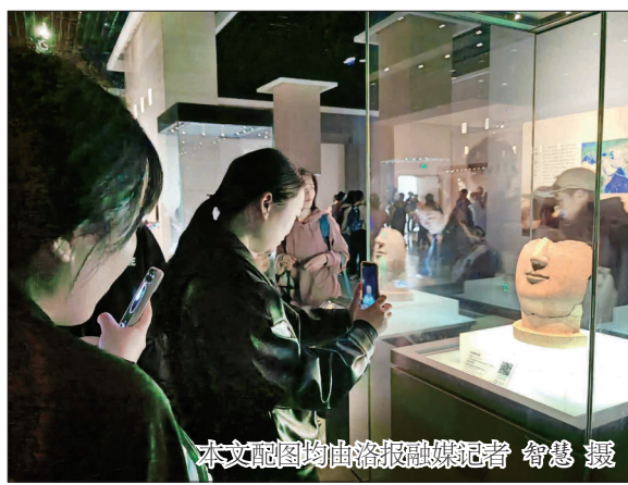
游客在洛阳博物馆感受厚重文化