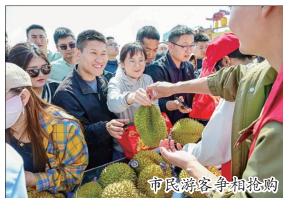
市民游客争相抢购