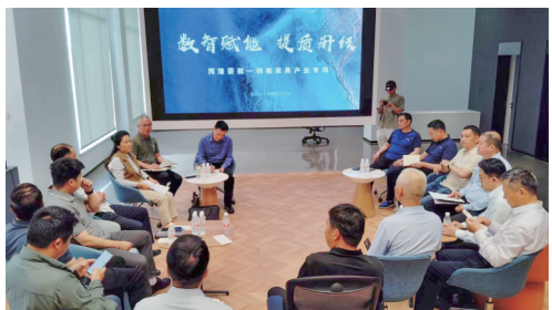
中行洛阳分行向钢制家具企业提供灵活便捷的金融服务

洛阳钢制家具产业产品涵盖办公、民用、校用、医用等多个领域,是洛阳市轻工业的重要支柱产业。中国银行洛阳分行积极践行“行长进万企”,优化金融服务模式,深化银企合作,以“金融活水”助力洛阳钢制家具产业发展。