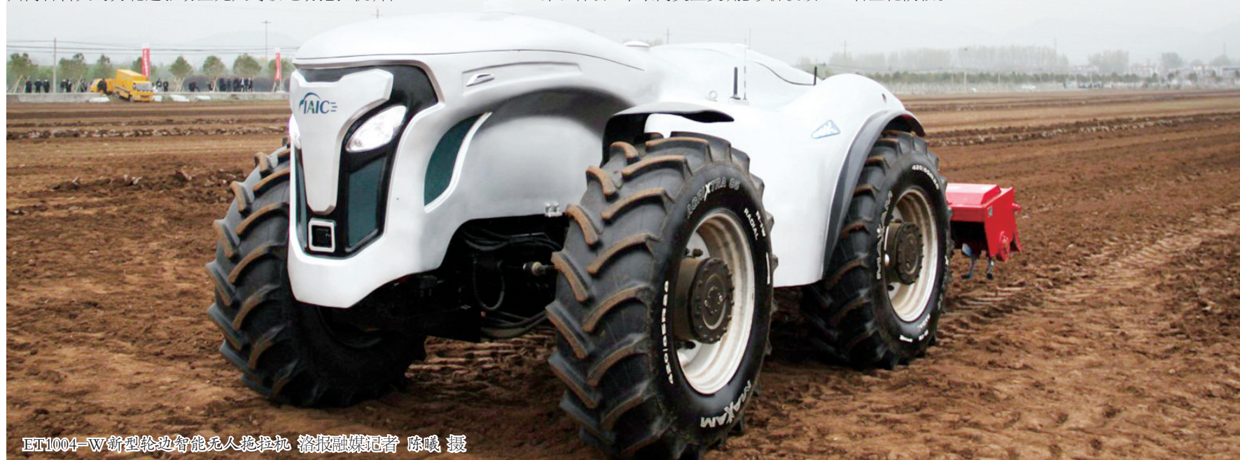
ET1004-W新型轮边智能无人拖拉机

此外，在本次大赛中，由丁兰团队（河科大）研发的“冰心思洛”灯具造型设计获概念设计组优秀奖。在产品组设计组获优秀奖的“洛阳创新”包括：中色科技股份有限公司2800毫米六辊铝带冷轧机组、洛阳矿山机械工程设计研究院有限责任公司智能预警处置一体化系统、洛阳东方众成离合器有限公司大功率拖拉机双作用离合器、中航光电科技股份有限公司372千瓦时浸没式液冷储能系统、大鱼视觉技术（河南）有限公司液晶显示面板（LCM）点灯检测设备和万基控股集团石墨制品有限公司新结构异型石墨化阴极。