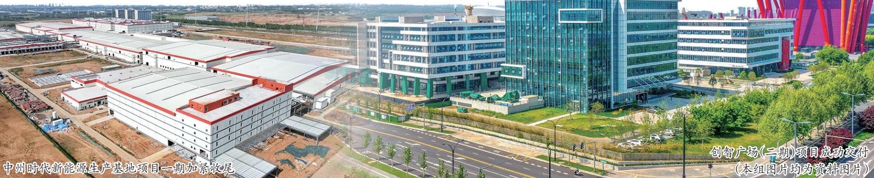
中州时代新能源生产基地项目一期加紧收尾