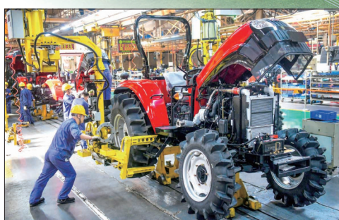
中国一拖大拖公司工人在装配拖拉机