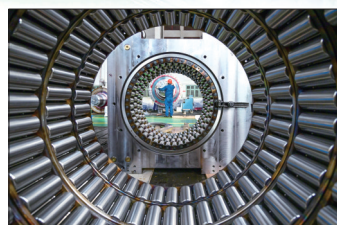
中信重工工人在赶订单

铿锵向前,每一步都是新的抵达。冲刺!中州时代新能源生产基地项目一期加紧收尾,一栋栋标准化厂房壮观排列,配套设备进场安装,下半年投产目标触手可及,吸引不少在外洛阳人喊话:“招人吗?等我!”