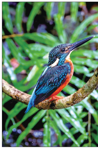
国家二级重点保护野生鸟类斑头大翠鸟