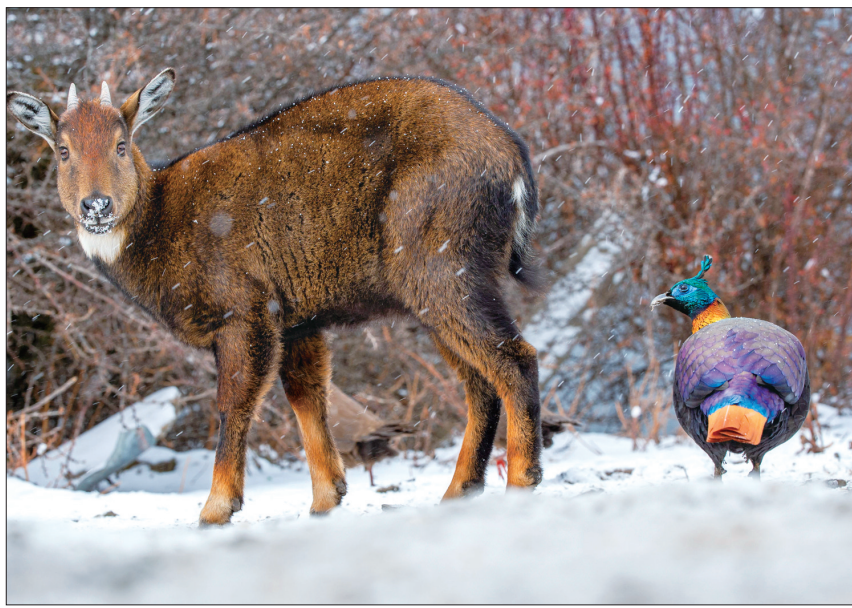
西藏山南市洛扎县的喜马拉雅斑羚和棕尾虹雉 (本组图片均据新华社)