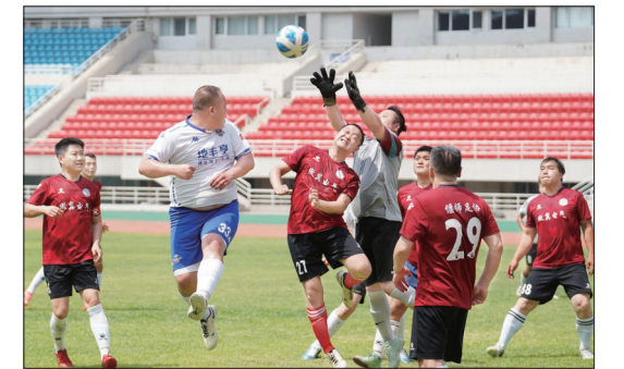
全民健身运动会足球赛鸣金

近日,由洛宁县妇联联合洛宁县人民医院打造的我市首个“孕妈妈驿站”揭牌成立,为孕产妇女、孕产妇及其家庭提供生育关怀服务,呵护孕产妇女和新生儿健康。该驿站设在洛宁县人民医院,每周开设多样课程,邀请相关科室医生、家庭教育讲师、心理咨询师等主讲孕期及产后知识、家庭教育方法及心理疏导方法,鼓励孕产妇女调整状态,适应角色变化,同时开设瑜伽、手工等课程,让孕产妇女丰富生活、愉悦心情。(蒋颖颖 丹慧)