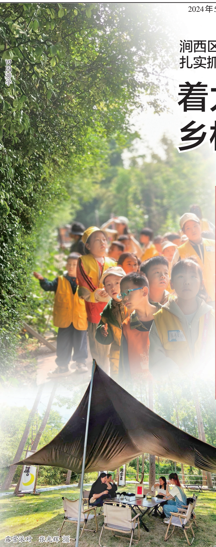
露营派对