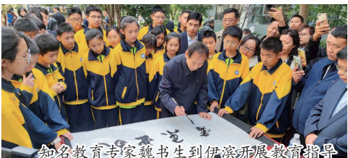
知名教育专家魏书生到伊滨开展教育指导

校区宽敞漂亮,各项功能一应俱全;教室设备更加人性化,配备可升降课桌椅;学生宿舍有热水洗浴间,新餐厅可容纳3000人同时就餐……如今的洛阳师范学院附属高级中学,已成为伊滨区教育高质量发展的生动注脚。