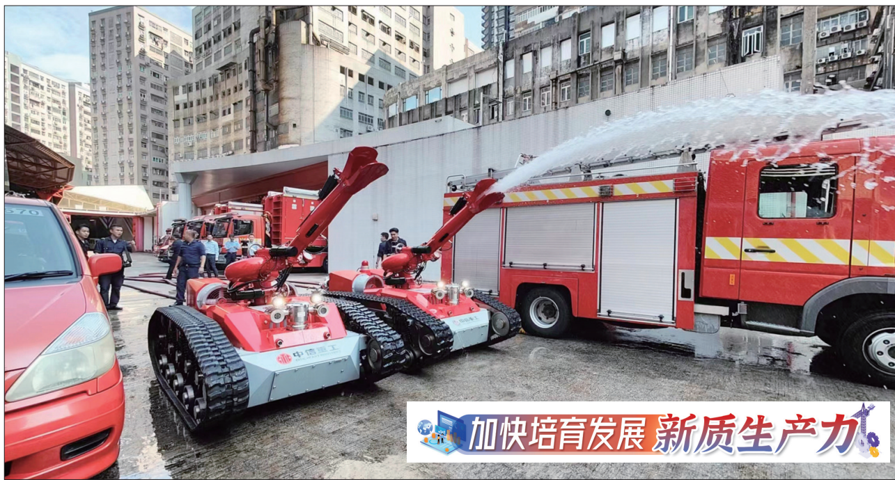
加快培育发展新质生产力