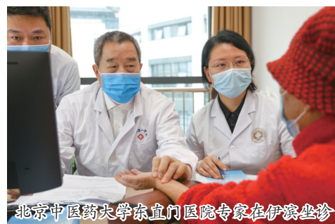
北京中医药大学东直门医院专家在伊滨坐诊

提升基层医疗服务水平。编制区级医疗专项规划,实施医疗服务体系建设工程,构建“15分钟医疗服务圈”;推动思亲医院成功创建二级综合医院,提升改造葛镇、庞村镇、寇店镇三镇卫生院,配齐医疗设备,建设数字化、智能化基层医院,提升乡镇卫生院服务能力;按照区级医院服务标准建设李村卫生院,推动香山中医馆开诊、孝文街道第二社区卫生服务中心投用,打造省级基层医疗卫生机构实践样板。