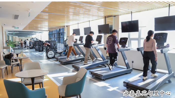
永泰嘉苑邻里中心