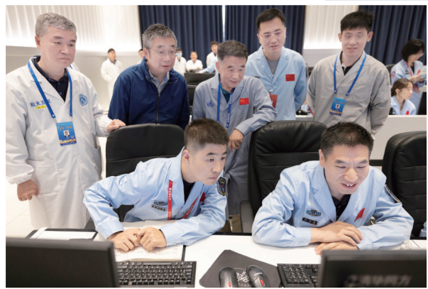
6月2日,北京航天飞行控制中心工作人员在查看嫦娥六号着陆器和上升器组合体传回的数据